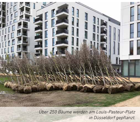
Über 250 Bäume werden am Louis-Pasteur-Platz in Düsseldorf gepflanzt.