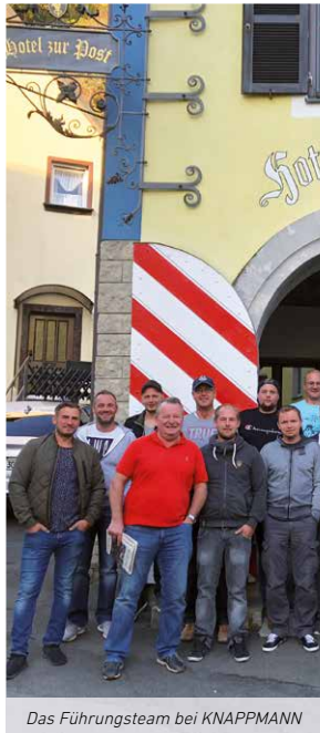
Das Führungsteam bei KNAPPMANN