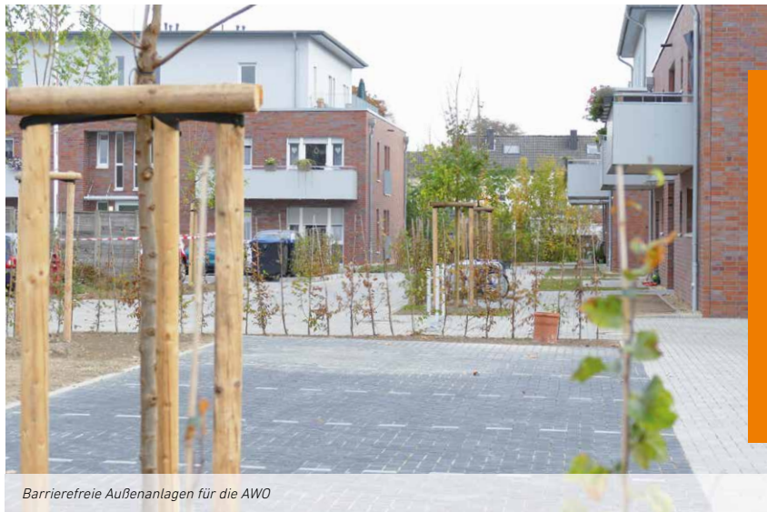
Barrierefreie Außenanlagen für die AWO

Die AWO Wesel erteilte KNAPPMANN den Auftrag in Neukirchen-Vluyn die Außenanlagen für drei Mehrfamilienhäuser mit dem besonderen Schwerpunkt der Barrierefreiheit zu errichten. Da die Häuser während des Baus der Außenanlagen bereits von den Senioren bewohnt wurden, stellte die Ausführung eine besondere Herausforderung dar. Die Senioren mussten nämlich jederzeit gefahrlos und unfallfrei ihre Wohnungen erreichen können.