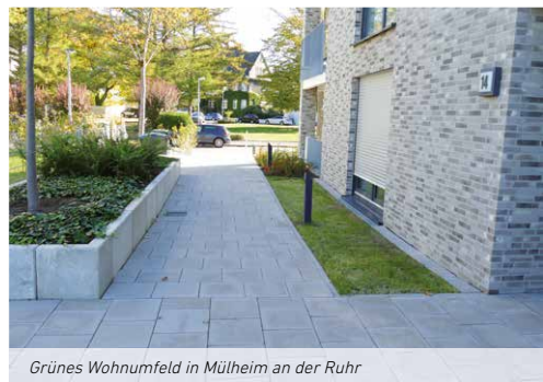
Grünes Wohnumfeld in Mülheim an der Ruhr

Auftraggeber: Max-Planck-Institut für Kohlenforschung, Mülheim an der Ruhr