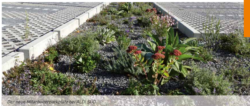
Der neue Mitarbeiterparkplatz bei ALDI SÜD

Auftraggeber: ALDI SÜD, Mülheim an der Ruhr Projektleitung: Olaf Schmitz, Architekturbüro Stülp Planung: Architekturbüro Stülp, Duisburg KNAPPMANN Bauleitung: Christopher Kuhl Baustellenleitung: Alexander Jung