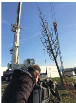
WDR-Dreh für die Aktuelle Stunde