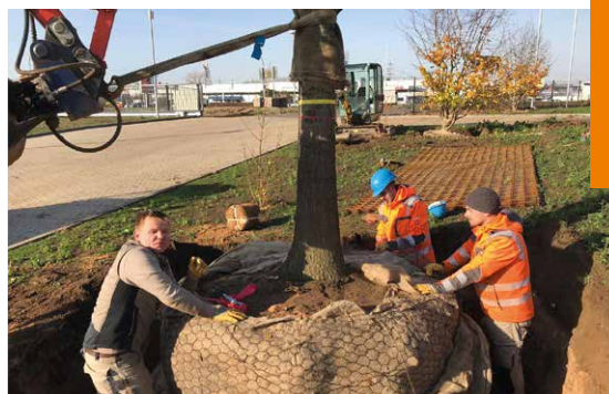
Großbaumpflanzung bei Naumann Stahl