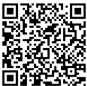
QR-Code scannen und Referenzvideo schauen!

Die neu errichtete zweigeschossige Kita „St. Augustinus“ des Caritasverbands Dortmund e. V. befindet sich auf einem ehemaligen Krupp-Gelände, einem knapp 2.500 m 2 großen Eckgrundstück an der Oesterstraße 135 in Dortmund. KNAPPMANN hat den großzügigen 1.100 m 2 großen Spielbereich, den Zugangs- und Eingangsbereich sowie die Parkplätze gestaltet.